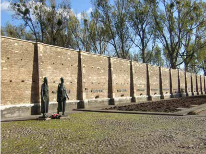
Heutige Ansicht der Mauer des ehemaligen Konzentrationslagers.