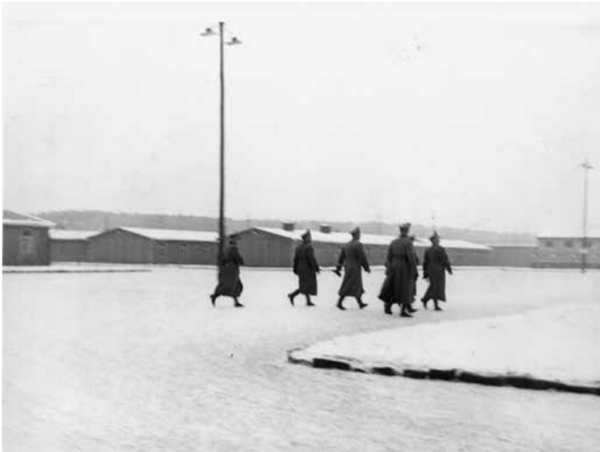
Aus dem SS-Album des Frauen-KZ Ravensbrück: Besuch des Reichsführers der SS und Chef der Deutschen Polizei Heinrich Himmler, und Gefolge auf dem Weg zum Barackenlager über dem sog. Appellplatz, 1940/41. Fotograf/in unbekannt, Mahn- und Gedenkstätte Ravensbrück, Foto-Nr. 1625.

Für diese Haftanstalt wählte man einen Platz am Schwedtsee, östlich von Ravensbrück. In transport- und verkehrstechnischer Hinsicht war die Lage günstig und alles konnte gut durch die großen Wälder getarnt werden. Im Winter 1938/39 bauten 500 Männer aus dem Konzentrationslager Sachsenhausen die Anlagen in Ravensbrück. Es wurden 14 Wohnbaracken, 2 Krankenbaracken und eine Baracke mit Küche und Duschen errichtet.