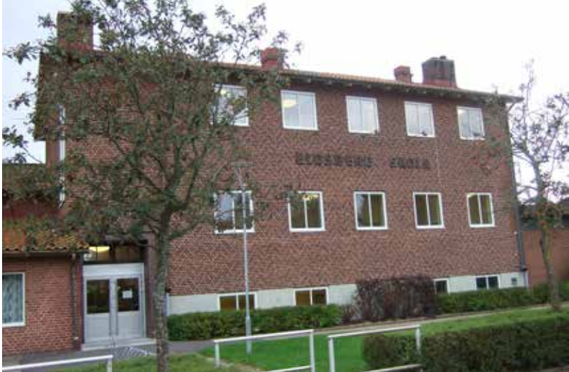
Die Grundschule von Eldsberga.