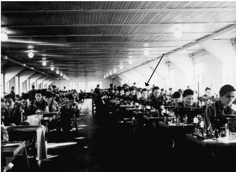
Häftlingsarbeit in der Schneiderei. Photoalbum der SS, 1940–1941. Fotograf/in unbekannt. Mahn- und Gedenkstätte Ravensbrück, Foto Nr. 1679.

Für mich war diese Arbeit sehr wichtig und sie hat mir viel gegeben. Ich hoffe, dass ihr auch daran Teil hattet und es euch dazu gebracht hat, über dies alles nachzudenken.