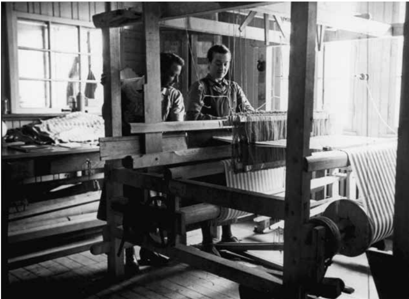
Aus dem SS-Album des Frauen-KZ Ravensbrück: In der Weberei; zwei Personen am mechanischen Webstuhl, 1940/41