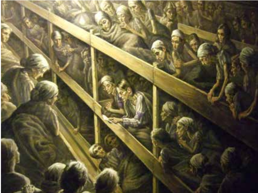
Gemälde „Zeuginnen Jehovas im Frauen-KZ Ravensbrück“; Öl auf Leinwand; Künstler: Joseph Brown, New York, USA. Sammlungen MGR/SBG, V1604 L2

Während der Arbeitszeit durften die Häftlinge nicht auf die Toilette gehen. Wenn es einmal eine wagte, sich doch dorthin zu schleichen, wurde sie mit einem Stock geschlagen. Sie wohnten in Baracken. Es gab Stockbetten mit drei Etagen und in jedem Bett schliefen zwei bis drei Frauen.