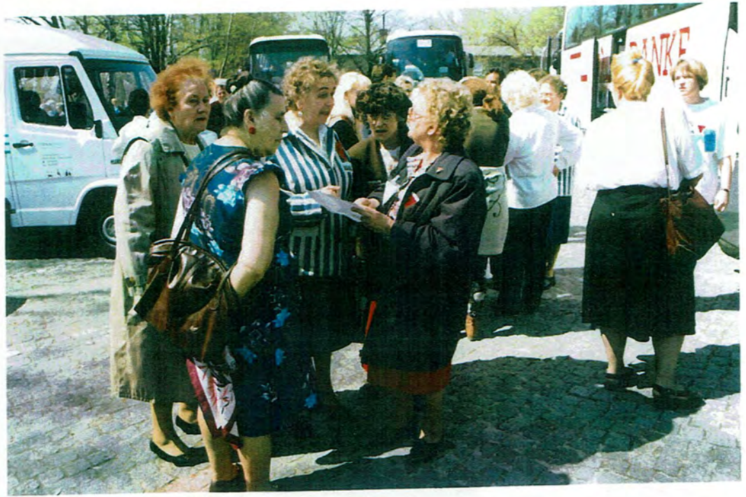
Rencontre avec des déportés soviétiques - 1995