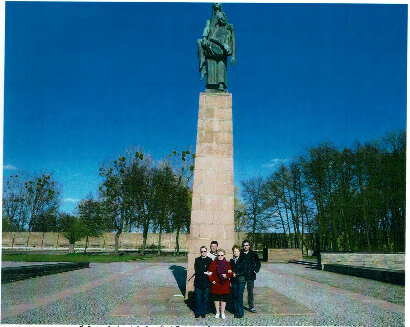
MOI ET MES ENFANTS